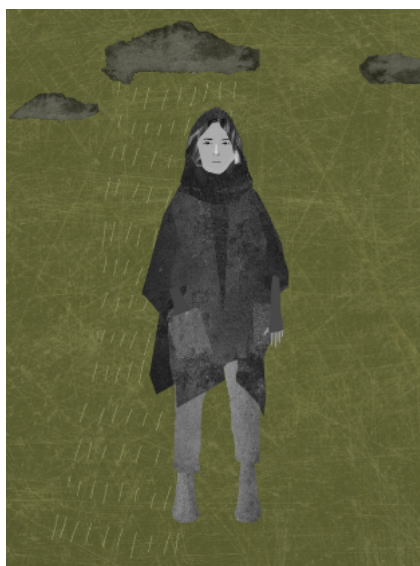
Costumes par Izabele Narecionité