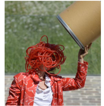
Le Dos de la langue

Les Crayons , c'est une boîte à outils, un moulin, un accélérateur, pour créer spectacles, scénographies et projets culturels.