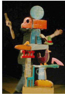
Une Seule Terre