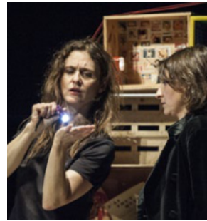
Sortie de Boîtes