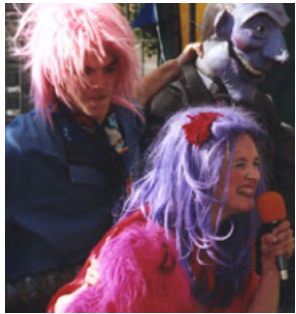
Tout ou Rien