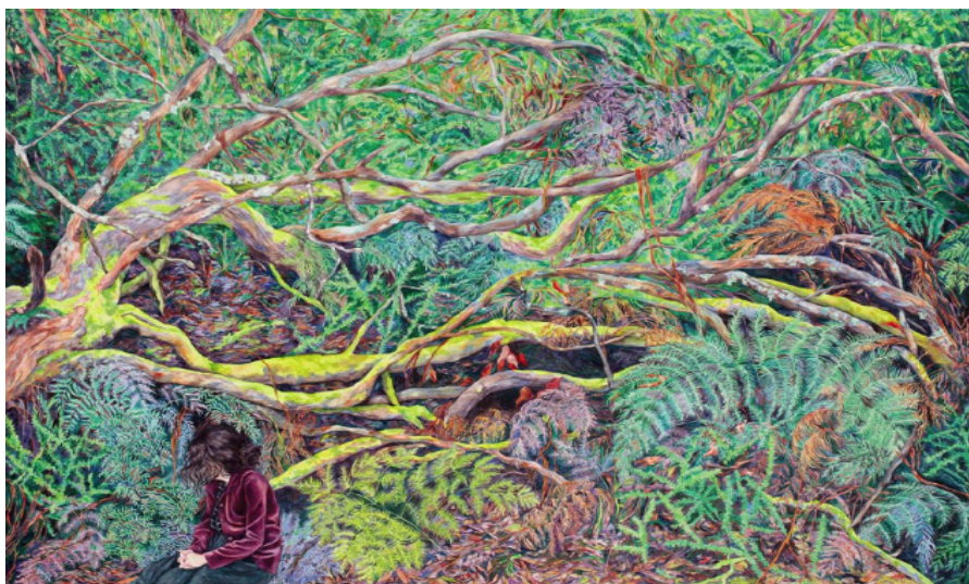
Peinture Monica Rohan - Cold hands